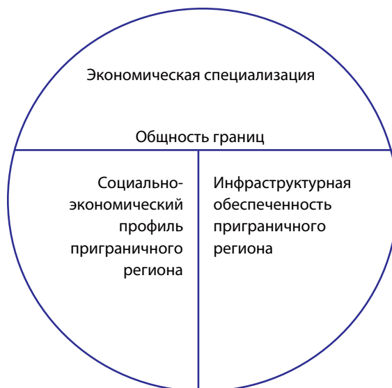
Рис. 1. Концептуальная модель трансграничного макрорегиона