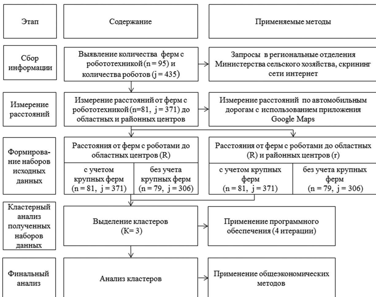
Рис. 1. Методика исследования влияния расстояния до крупных городов и районных центров на интенсивность применения робототехники в сельском хозяйстве